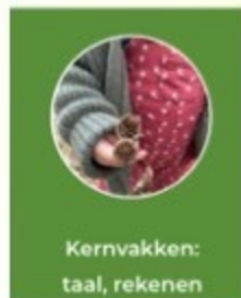
Kernvakken: taal, rekenen

Ons concept wordt steeds concreter. De laatste ontwikkelingen kun je lezen op onze website: www.marimbaschool.nl . Kijk vooral even wat er onder deze foto's staat.