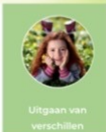
Uitgaan van verschillen