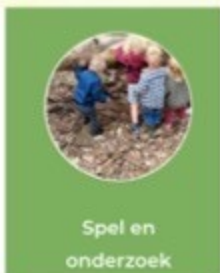
Spel en onderzoek